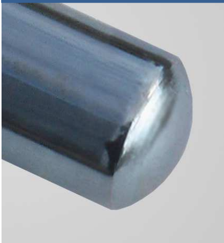
Bild1: Rohrenden können ohne zusätzliche Materialzuführung sicher und sauber verschlossen werden