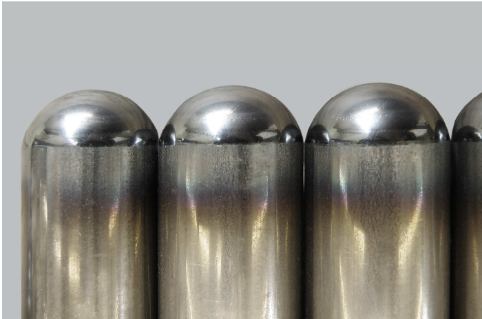
Bild2: Da das Werkstück nicht bewegt wird, können auch nicht rotationssymmetrische Geometrien bearbeitet werden